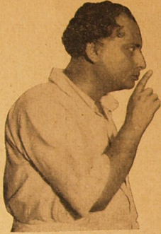
কাছে এসে এ বাণীও শোনাল।